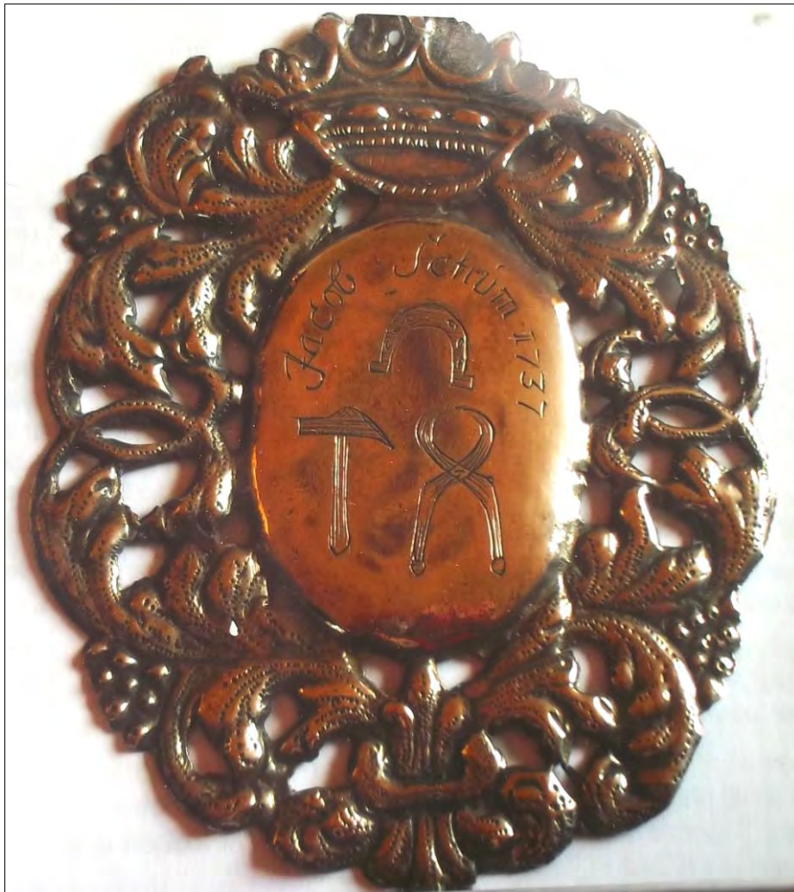
Willkomm-Schild der Libauer Huf- und Waffenschmiede-Innung