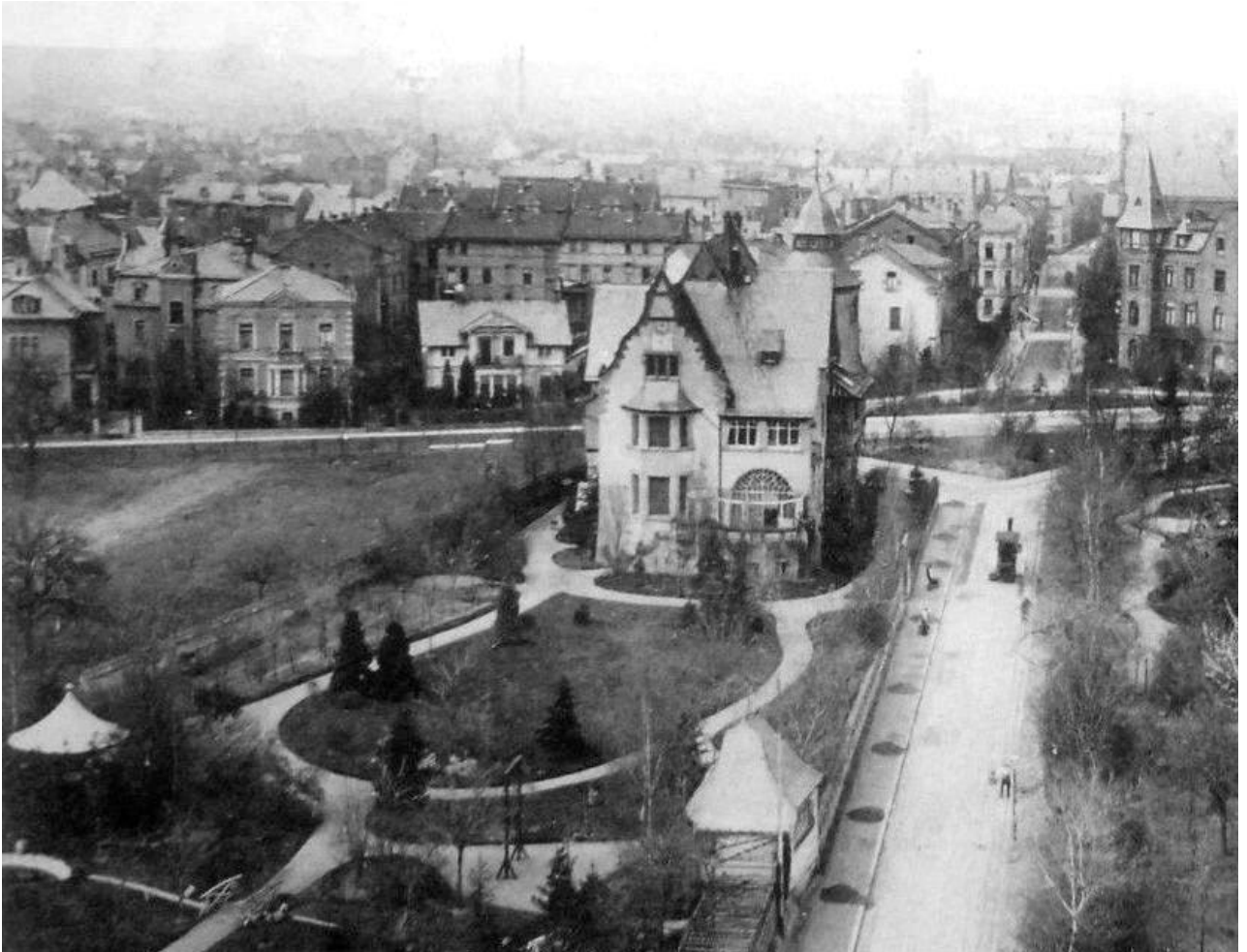
Blick vom Garten auf das ehemalige Haus Haardteck im Februar 1902, heute „Haus der Deutsch-Balten“ mit der DGBG-Bibliothek in der 1. Etage.

Kuessner, Dietrich: Landesbischof D. Alexander Bernewitz 1863-1935. Vom Baltikum nach Braunschweig. Mit einer Karte „Livland, Estland und Kurland, die Deutschen Ostseeprovinzen Rußlands, bis zum Ersten Weltkrieg“. Eine Studie. Arbeiten zur Geschichte der Braunschweigischen ev.-luth. Landeskirche im 19. und 20. Jahrhundert, Nr. 4. Büddenstedt 1985 (Signatur IV 2, 58)